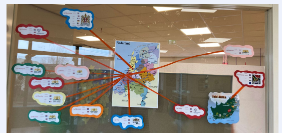
Ook de taalachtergronden in het team zijn zichtbaar: Obs De Notenkraaker, Den Haag.

Thuistaal en cultuur zichtbaar gemaakt: De Argonaut, Almere.