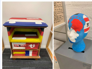
Leerlingen kunnen op een lijst buiten de klas zien welke talen er door wie worden gesproken: De Gelderlandschool, Den Haag.