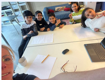
Als je voor je studie informatie zoekt over India, kun je het ook gewoon aan de kinderen op school vragen: Jenaplanschool De Driestam, Eindhoven.