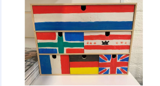
Studenten uit Emmen verbeelden hun taalportret: NHL Stenden Hogeschool/ Lectoraat Meertaligheid en Geletterdheid.

Het enthousiasme was groot toen leerlingen bij het invullen van dit werkblad hun thuistaal mochten gebruiken: Kernschool, Zaandam.