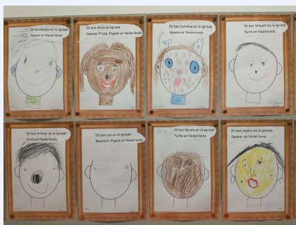
Ook jonge kinderen kunnen hun taalportret tekenen: Lorentzschool, Leiden.