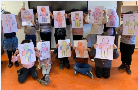
Taalportretten groep 4: Kbs De Windroos, Enschede.